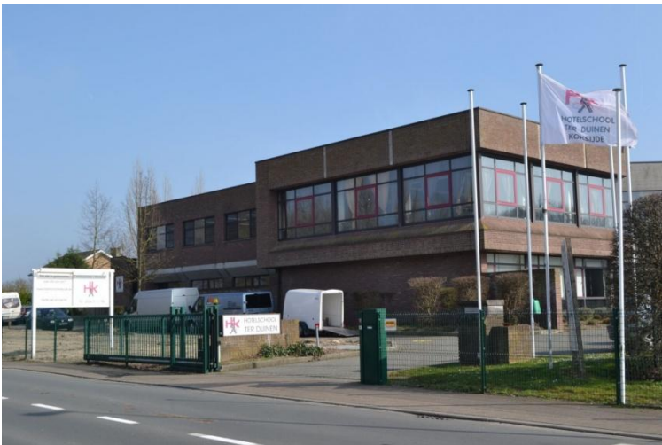
Foto hieronder : Hotelschool Ter Duinen, Koksijde

° 23.09.1897 Antheit + 20.07.1994 Sint-Idesbald